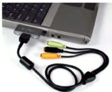
スピーカーケーブルを接続した状態

このソフトは、以前にも紹介したものですが、CD製作やMP3形式にエンコードしたりと、大変な優れ物です。何よりも、わかりやすく見やすい画面が評価を受けています。また、使い方を詳しく紹介したサイトもいいですね。